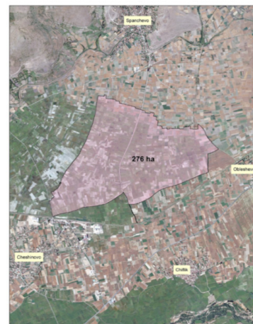
Консолидационно подрачје Спанчево

Ќе се обноват постојните канали за одводнување.