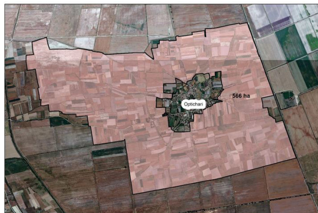
Консолидационото подрачје во с. Оптичари

Ќе се обноват постојните и ќе се изградат нови пристапни патишта и канали за одводнување