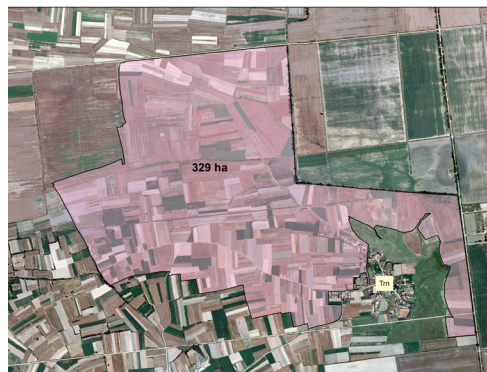
Карта на консолидационото подрачје Трн

Санирани постојни и изградени нови канали за одводнување