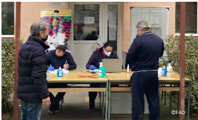
Собрание на учесници во консолидација во с. Соколарци